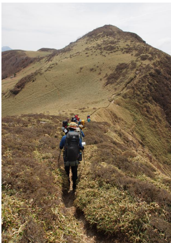
▲ おかめ岩からの縦走路