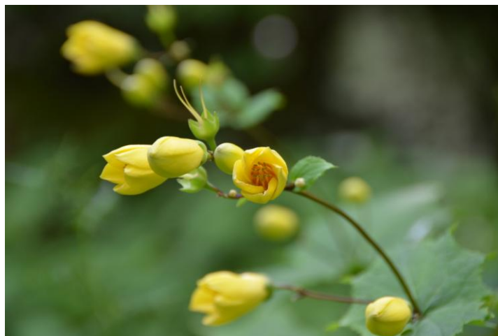
▲ キレンゲシヨウマ

うだる暑さの下界におさらばし花と涼を求める チームと剣&次郎笈の2チームで《剣山》を訪ね ました。一面の笹原を渡る風は涼しくキレンゲシ ヨウマの花も可愛く其々に満足の山行でした♪