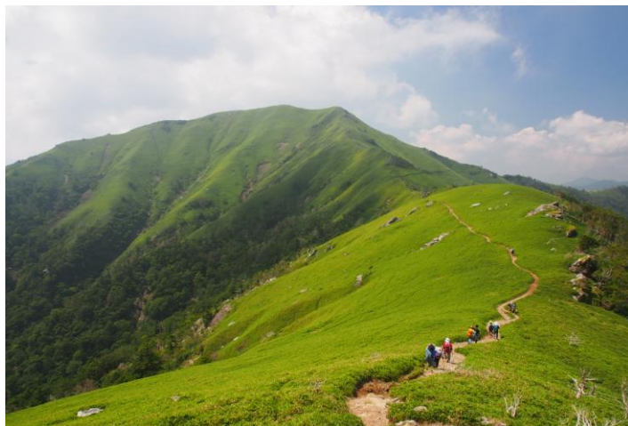
▲ 剣山からの次郎笈