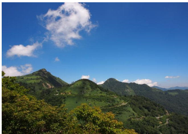
▲ 子持権現からの景色

「頑張って歩きたい人集まれ～」今日は、伊吹山～瓶ヶ森の縦走とオマケで子持権現山に挑戦！青空と涼やかな風に吹かれる縦走は気持ち良く子持権現は中々手強くビビりました♪