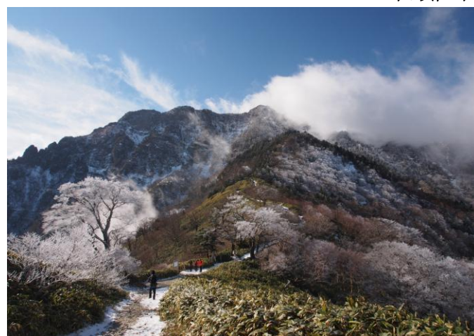
▲ 夜明峠からの石鎚山

新年第二弾の山も《石鎚山》敬愛する地元の人気山なので3日に続き再度山頂に立つ皆さん&ゆっくり冬景色を楽しむ皆さんとの合同チームで其々に目的通りの雪山を楽しみました♪