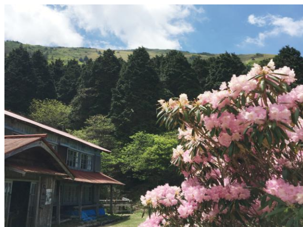
▲ 丸山荘とシャクナゲ

青い空に白い雲、吹く風は爽やかでオマケに花は満開！登山に持ってこいの好天の日に《笹ヶ嶺》を訪ねました。四国の山らしい笹原の向こうに石鎚山。気持ちの晴ればれする山行でした♪