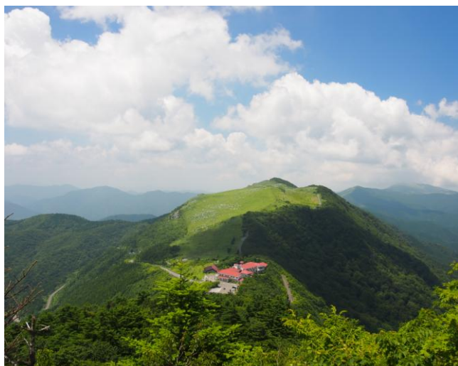
▲ 展望台からの風景