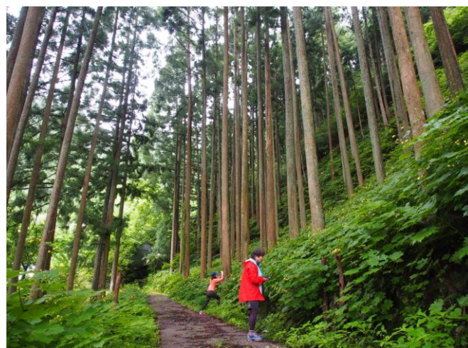
▲ キレンゲショウマ群生地

青い空と白い雲、風は爽やか今日は《大人の夏休み》のんびりと夏草のカルストをハイキング♪温泉を楽しんだ後は、お宿のお心づくしの品々で酒盛り。翌日は花を愛で高知の艦で乾杯でした♪