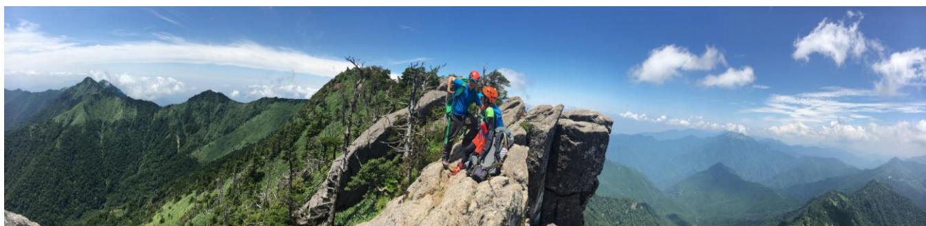
▲ 南尖鋒からのパノラマ