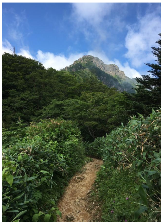
▲ 登山道からの石鎚山